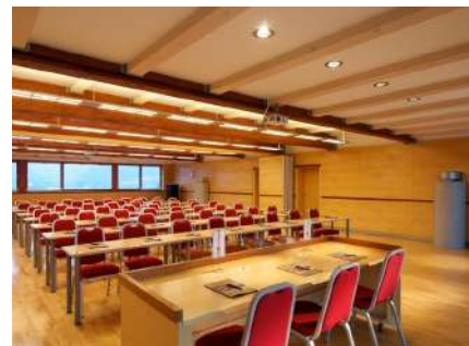
Večnamenska dvorana Panorama

Večja kot je uporaba dolga glede na kapital za financiranje poslovanja podjetja večje je tveganje, povezano z višino prihodkov. To tveganje nosijo lastniki družbe.